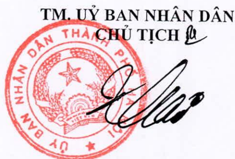
Nguyễn Thế Thảo